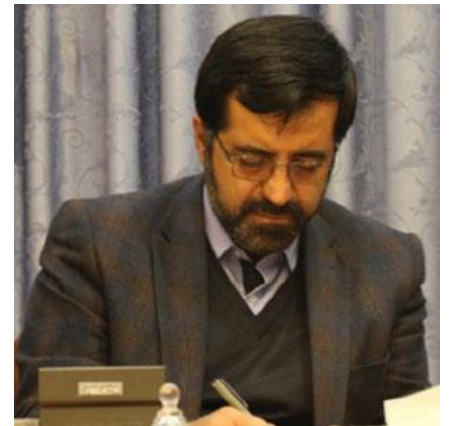
جناب آقای مهندس اکبر بهنام جو (استاندار محترم اردبیل)