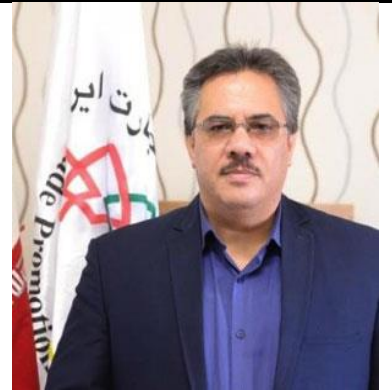
دکتر علیرضا مودودی (رئیس سازمان توسعه تجارت ایران)

برنامه کنفرانس نمایشگاه گردشگری سلامت کشورهای عضو اکو (28-30 خرداد 98)