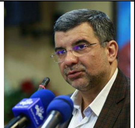
جناب آقای دکتر ایرج حریرچی (قائم مقام محترم وزیر بهداشت)

برنامه کنفرانس نمایشگاه گردشگری سلامت کشورهای عضو اکو (28-30 خرداد 98)